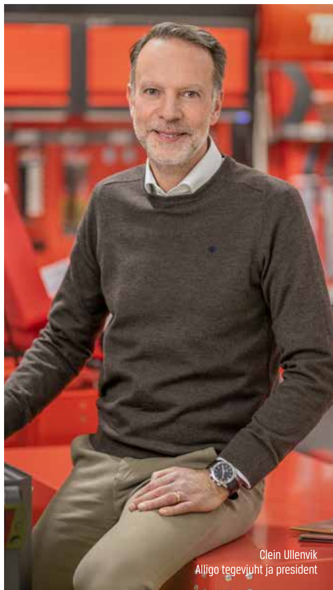
Clein Ullenvik Alligo tegevjuht ja president

Meie põhiväärtused väljenduvad kolmes sõnas: pühendumus, koostöö ja asjatundlikkus. Usume, et see annab panuse mitte üksnes edu saavutamisse ettevõtetena, vaid ka kõigi meiega koos töötavate inimeste heaolu tagamiseks. Teame ka seda, et usalduse tugevdamisel meie ettevõtte vastu on otsustava tähtsusega see, kuidas me käitume nii ettevõttesiseselt kui ka väljaspool ettevõtet, suheldes tarnijate ja klientidega. Oleme börsil noteeritud ettevõtte, kes nõuab endalt palju. Meie visioon on olla võitmatu. Seepärast on käitumiskoodeks koos põhiväärtustega meie tegevuse nurgakiviks.